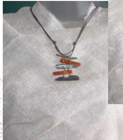
1211304 Madrepérola e coral