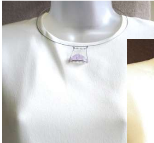
0212120co Ametista (golfinho)