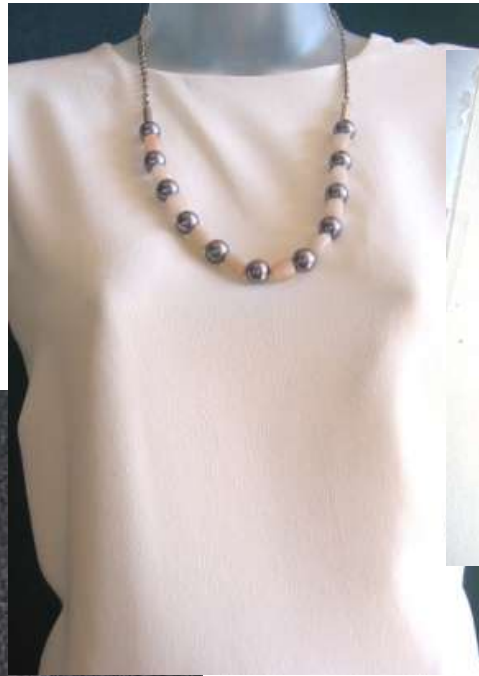
0411108 Quartzo rosa