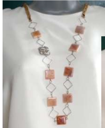
1011101 Ágata de fogo, gaiola prateada, sisal