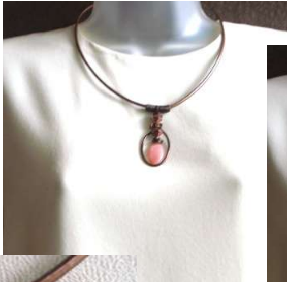
0212122co Opala rosa