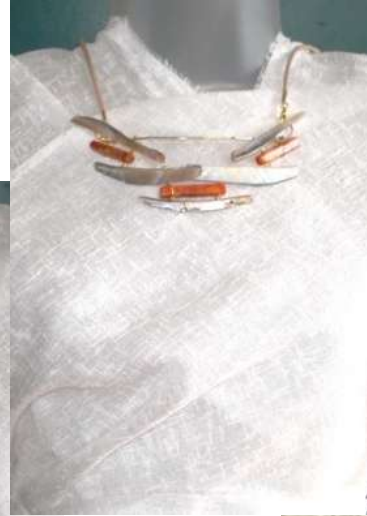
1211306 Madrepérola e coral