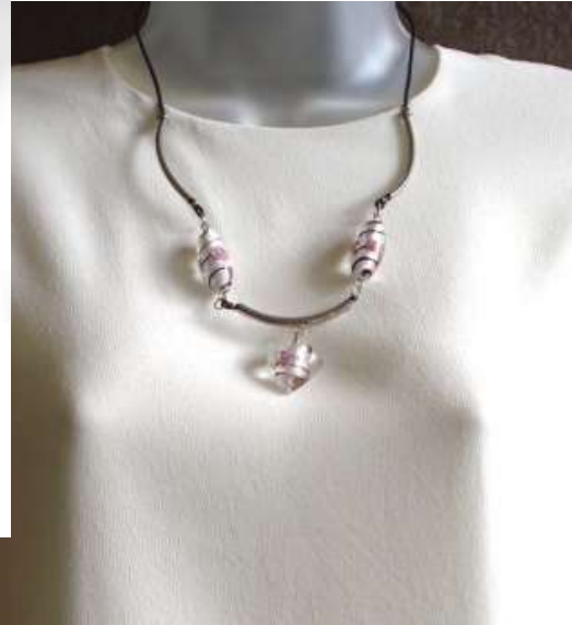
0212421co Vidro (com rosa)