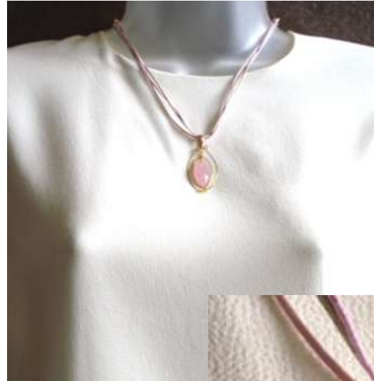
0212125co Quartzo rosa