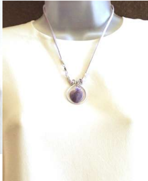
0212128co Ametista (coração)