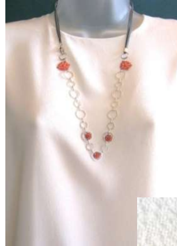
0711202 Metal esmaltado + Ag