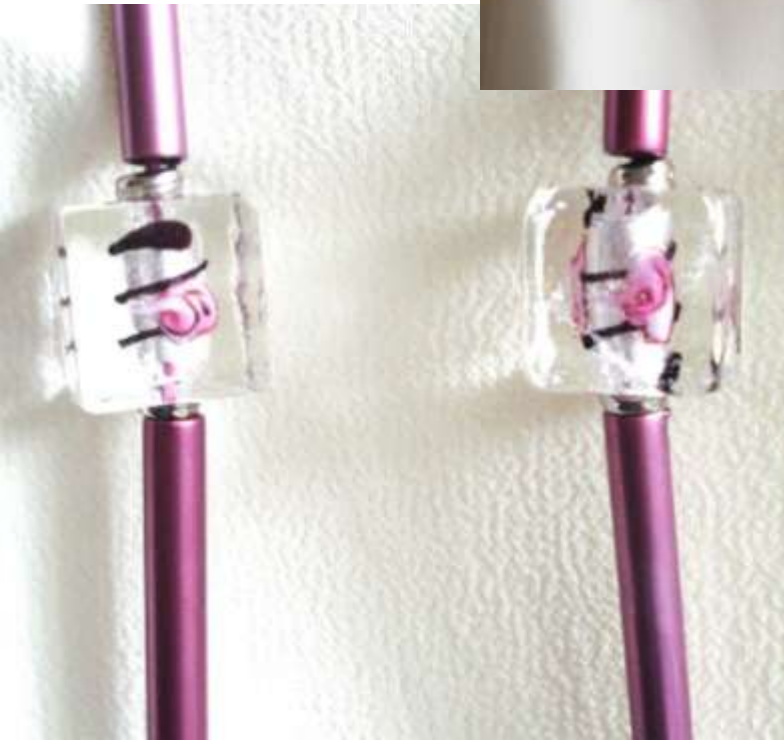
0212420co Vidro (com rosa)