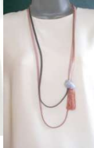
1111108 Calcedônia, franja (fio banhado a prata)