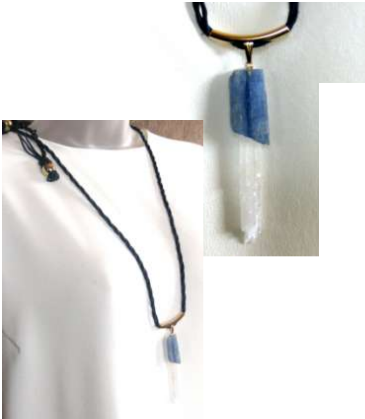
0712106 co Cianita azul e selenita