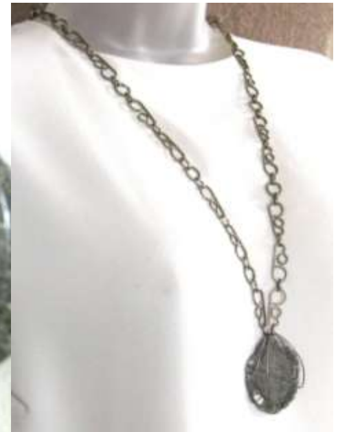
0712107co Pirita sol