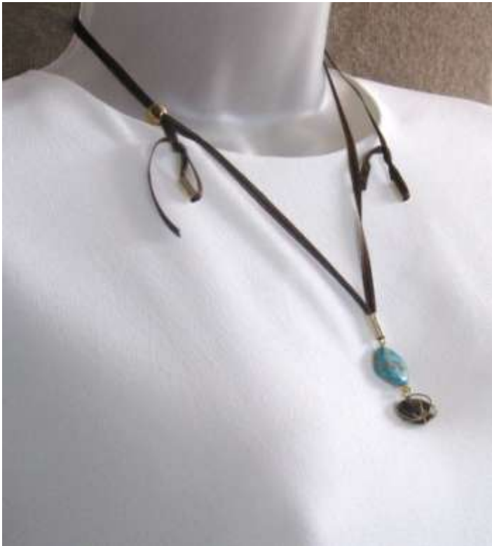
0712801 co Turquesa e reuso de pedra marrom