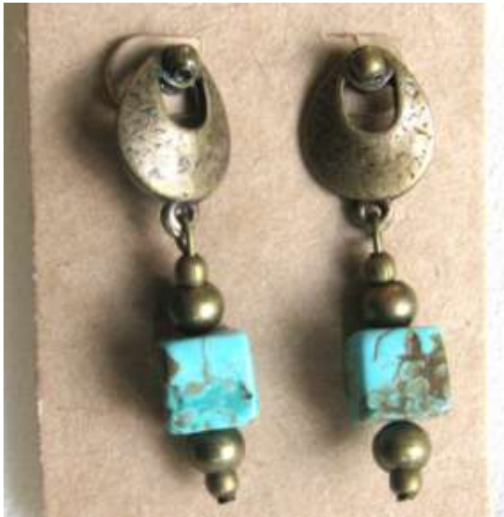
0712124 br Howlita turquesa