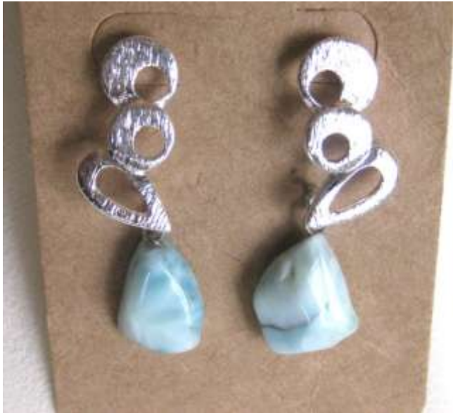
0712126 br Larimar