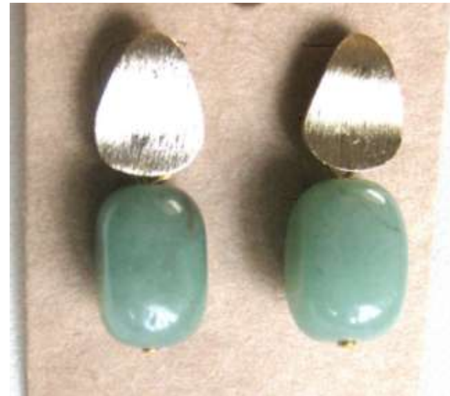
0712127 br Ágata verde