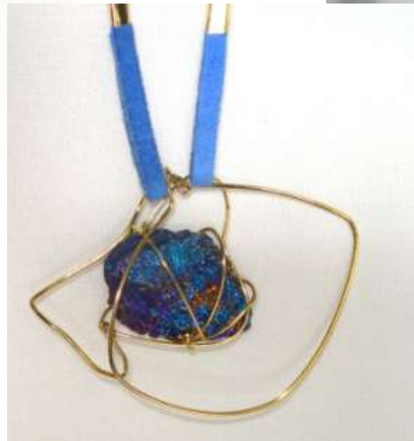
0712109 co Bornita