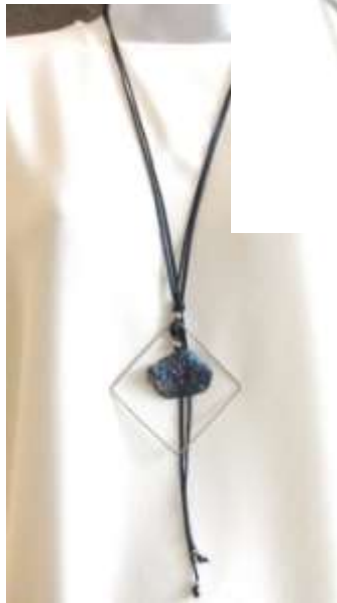
0712108 co Bornita