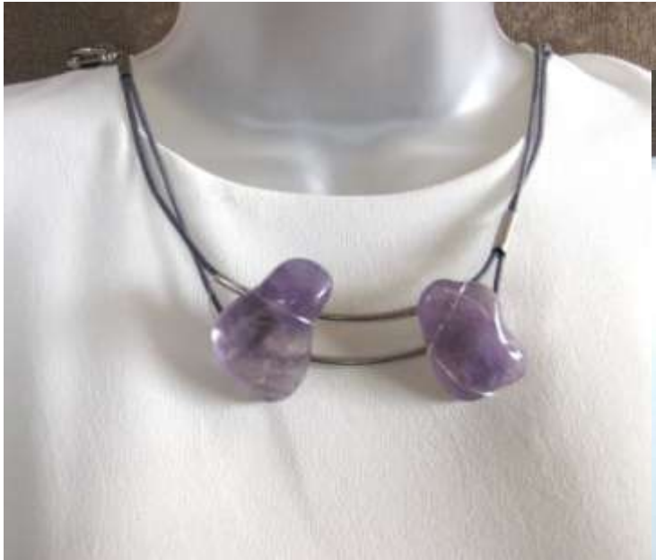
0712102 co Ametista