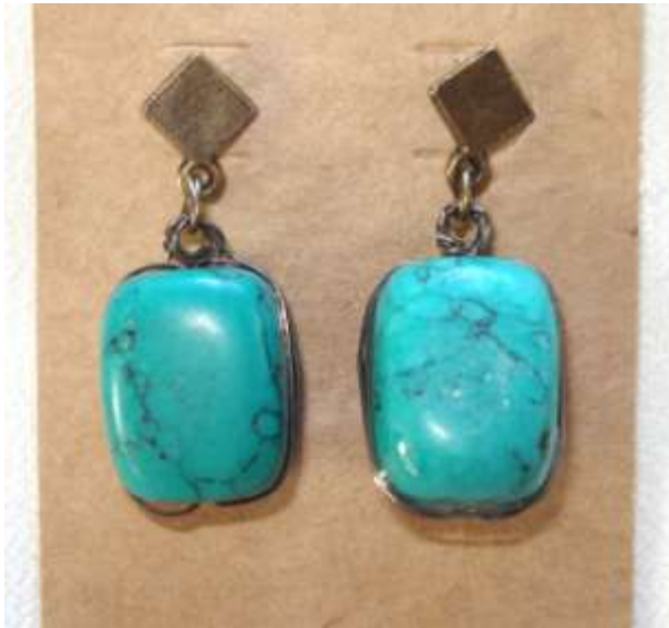
0712122 br Howlita turquesa