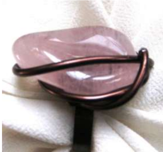
0712142 an Quartzo rosa