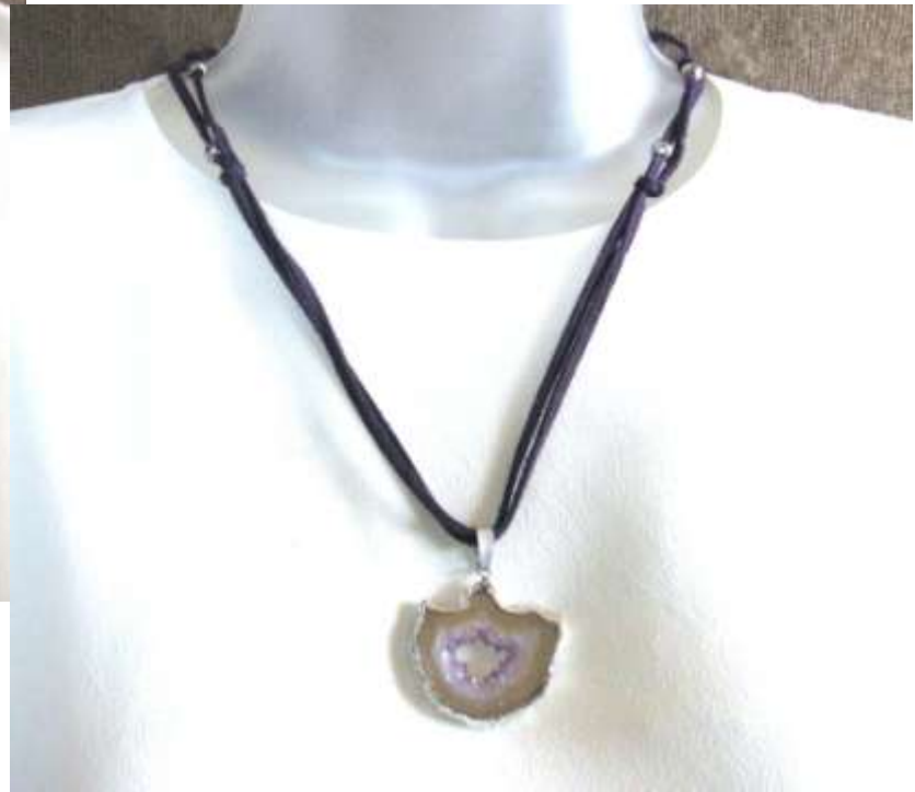
0712103 co Ágata cristalizada