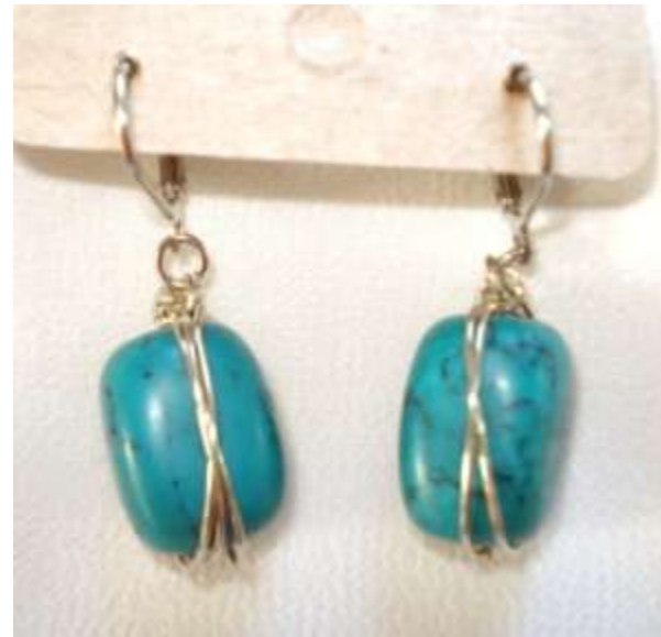
0712123 br Howlita turquesa