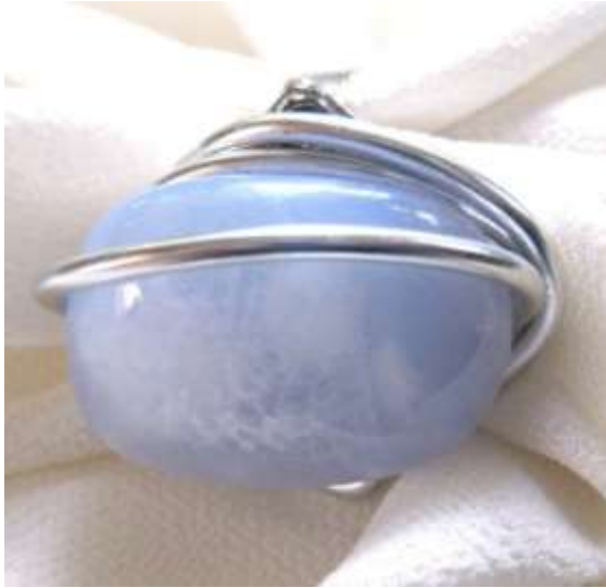
0712141 an Calcedônia