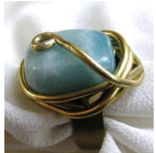
0712173 an Amazonita