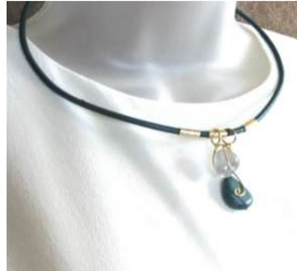
0712802 co Turquesa e reuso de pedra transparente