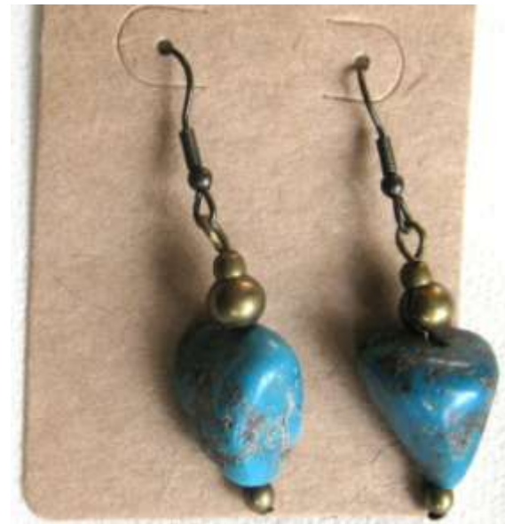
0712125 br Turquesa