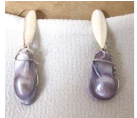
0113334 br Pérola