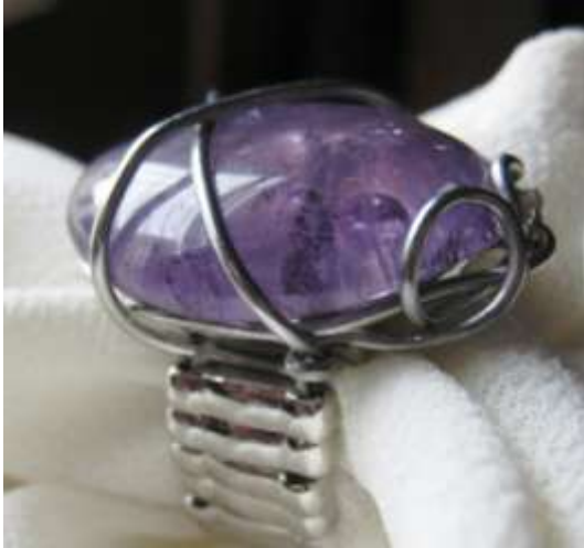
0113151 an Ametista