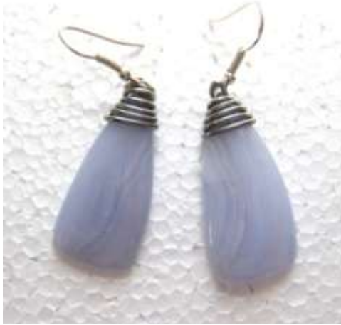
0113335 br Calcedônia