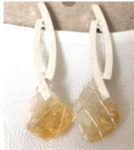
0113134 br Citrino