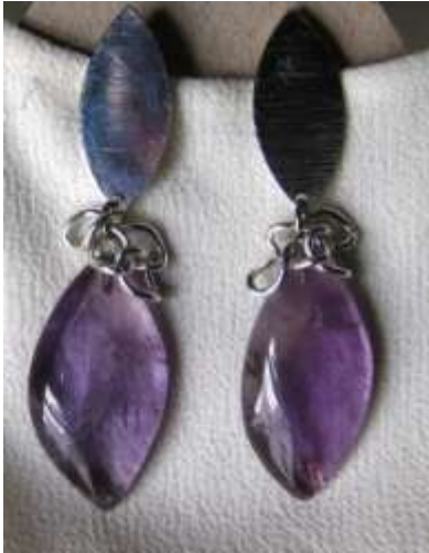
0113131 br Ametista