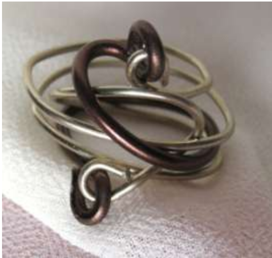
0113451 an Alumínio