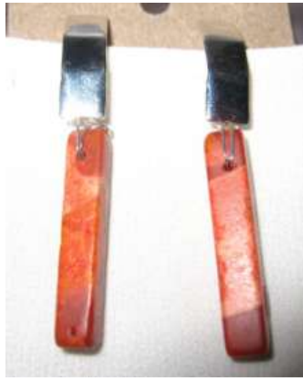
0113333 br Coral