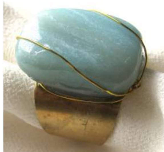
0113154 an Amazonita