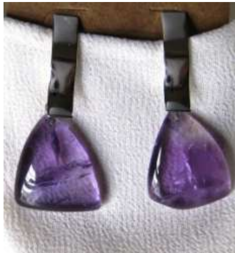
0113132 br Ametista