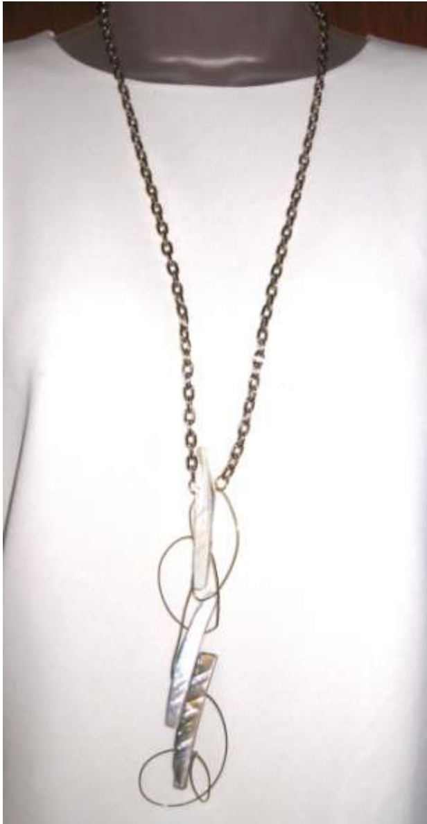
0113301 co Madrepérola