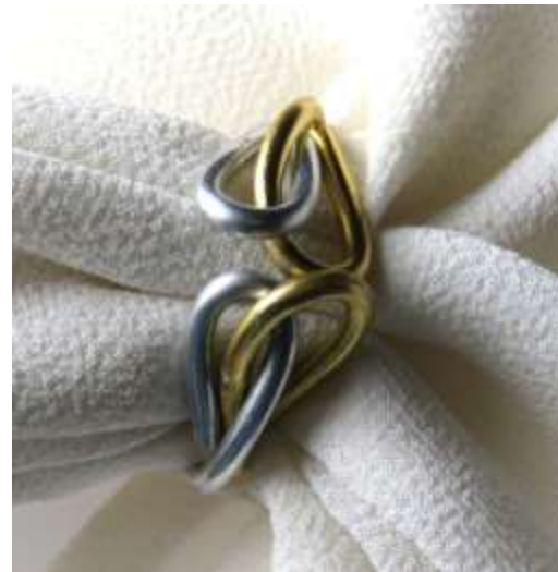
0113452 an Alumínio