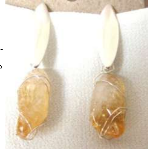
0113133 br Citrino